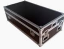
Aluminum Alloy Flight Carton